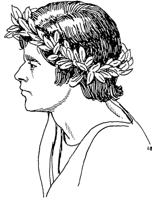
मुकुट पहिरल मनैया (२:१९)

१७हेरो भैयौ, हमन एकघरिक लाग दुहनसे दूर हुइ परल, तर फे हमार मन त दुन्हककेसँग बा। दुहन आमनेसामने देख्ना हमार एकदम धेर चाहना रलकओसे हम्न दुन्हकठे जाइक लाग स्याकलसम कोसिस कर्ली। १८हम्न त दुन्हकठे जाइक लाग रलही – वास्तवम मै पावल झन् घरीघरी कोसिस कर्नु – तर शैतान हमन छेकदेहल। १९काकरकि जब हमार प्रभु येशू अइहीं, तब आशा ओ आनन्द कर्ना, ओ मुकुटा पैलकम