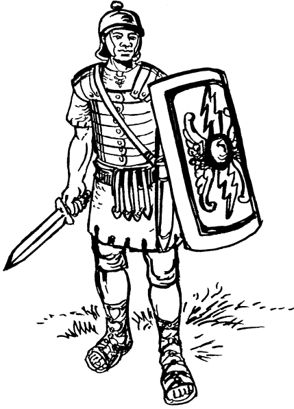
छातीपाता ओ टोप पहिरल सिपाही (५:८)

६ उहओसे हम्न औरजन्हकअस सुत नैपरट, तर जागा रहपठा ओ अपन्हेह अनुशासनम ढरपठा। ७ सुतुइयन रात्क सुलठ ओ मत्वरेन फे रात्क जो मत्वार हुइठ। ८ तर हम्न त दिनक सन्तान हुइलकओसे, हम्न अनुशासनम पलरही। विश्वास ओ प्रेमह छातीपाताअस, ओ मुक्तिक आशह टोपअस पहिके सुरक्षित रही। ९ काकरकि परमेश्वर हमारम आपन रिस झारक लाग नाहीं, तर प्रभु येशू ख्रीष्टद्वारा हमन मुक्ति देहक लाग रोज्लह। १० येशू हमार लाग मुल ताकि हम्न चाहा जीटीह रही, चाहा